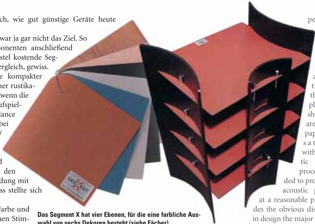
Das Segment X hat vier Ebenen, für die eine farbliche Auswahl von sechs Dekoren besteht (siehe Fächer).

Für viel weniger Geld bietet das Segment X schon viel HiFi-Feeling, das Levelplus „klingt“ sogar echt ambitioniert. Und in die Design-Ecke gehören beide garantiert nicht.