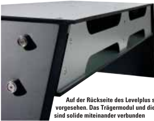
Auf der Rückseite des Levelplus sind Kabelöffnungen vorgesehen. Das Trägermodul und die seitlichen Stützen sind solide miteinander verbunden

The back panel of the Levelplus is provided with cable openings. The supporting body and the side panels are firmly connected with each other.